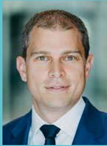
Eike Holsten MdL